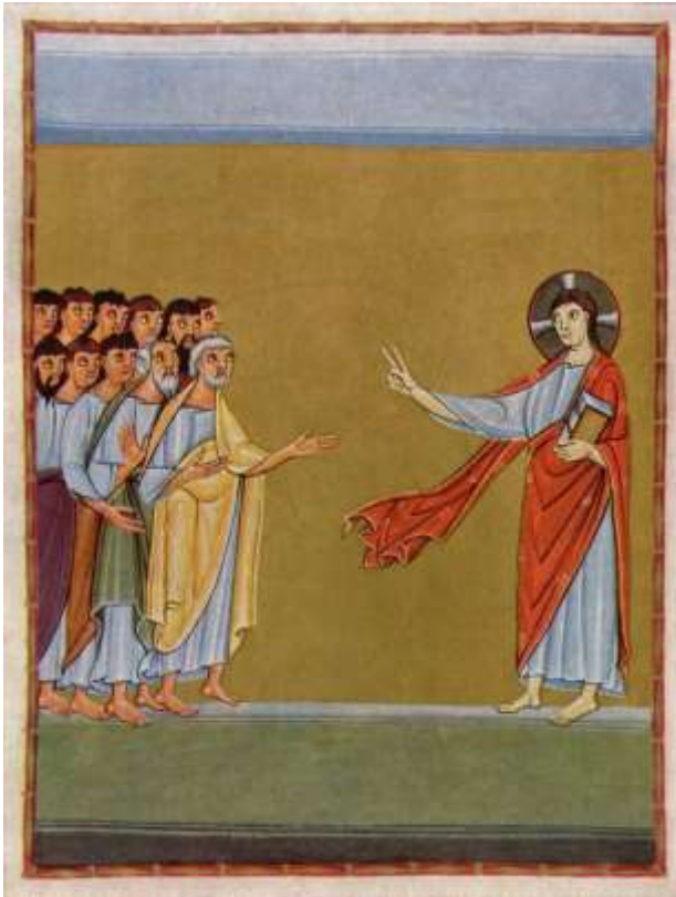
Reichenauer Schule, 11. Jahrhundert