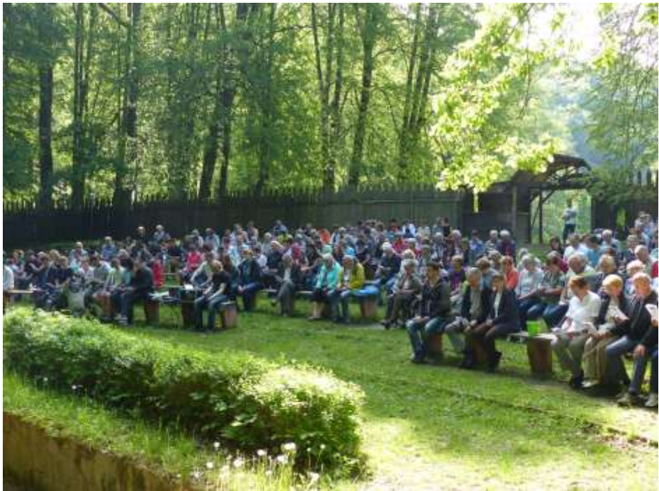
Foto: Himmelfahrtsgottesdienst 2018

Bei schlechtem Wetter findet der Gottesdienst in der Lutherkirche statt.