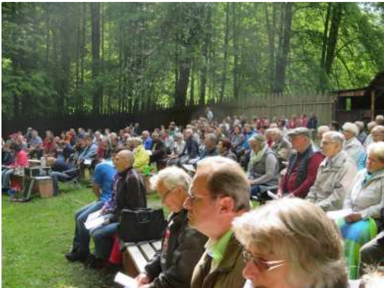
Foto: Himmelfahrtsgottesdienst 2017

Bei schlechtem Wetter findet der Gottesdienst in der Lutherkirche statt.